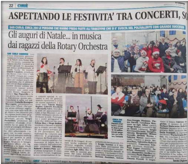
IL CANAVESE, 21 dicembre 2022