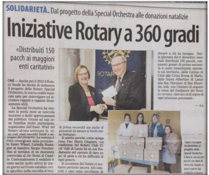
IL RISVEGLIO, 22 dicembre 2022